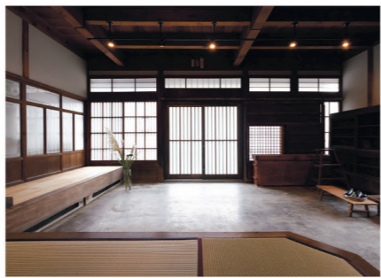
土間ではマルシェなどのイベントを開催。

伊予市の住宅街にある、築120年の日本家屋。通り土間での家の表と裏がつながる、伝統的な町家です。のれんをくぐり戸を引くと、まず表土間が現れます。造り酒屋を営んでいた時代、ここは客を迎える高い場でした。梁や柱などの木組みや天井は古材をそのまま活用。畳の張り替えや壁の塗り替えなどはあるものの、伝統的な建物の保存修理工事にも携った大工集団の施工により、ほぼ往時の佇まいを再現しています。土間の見どころの一つが、大黒柱を支える持ち送り。建築金具鍛造の名工、白鷹刃物工房(松山市)の和釘を使用することで、意匠性を高めました。当時の建具を生かし、大遷暦の歴史を感じさせる佇まいに。