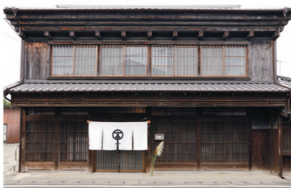
のれんを目印にお越しください。

酒屋が建てられ、2度目の改築で水まわりが増築されたという歴史があります。水まわりは昭和以降の建物のため、老朽化した設備はもちろん、床や壁なども一新。逆に古民家の雰囲気に寄せて改修しました。キッチンカウンターと同じタモ無垢材で造作した洗面台や収納付きミラー、アクセントタイルで、和モダンな趣を感じる空間へと生まれ変わりました。続く浴室も内部を檜張りにし、雰囲気合わせています。