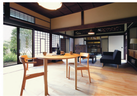
和室をフローリングに変更してダイニングに。

美しい日本庭園を臨む縁側は、老朽化の進んでいた床をあすみの松の無垢材に張り替えました。