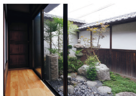
改修を機に坪庭も美しく整えました。

伊予市古民家モデルハウスは見学可能(要予約)ですので、気軽にお越しください。古民家を探している人、古民家を譲りたい人、農地とあわせて売れないか検討している人…。売買に関する無料相談会を今週末に開催します。(10時〜17時)。クラスの畑で採れた新鮮な野菜が並ぶマルシェやワークショップなど、古民家暮らしを体感できるイベントも随時開催中。クラスの最新情報は公式インスタグラムをご覧ください。